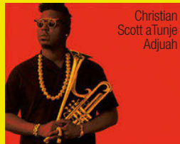
Christian Scott aTunde Adjuah