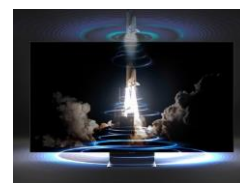
OTS (Object Tracking Sound)*

Un rétroéclairage Direct LED associé à la technologie Local Dimming Silver pour un contraste amélioré.