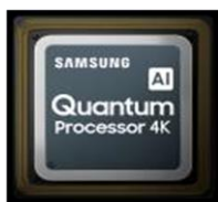
Quantum Processor 4K

La technologie Quantum Dots capte la lumière et restitue une palette de couleurs d'un réalisme incomparable qui ne se dégrade pas au fil du temps. Compatible HDR10+, les Q80T atteignent des pics de luminosité jusqu'à 1500 nits.