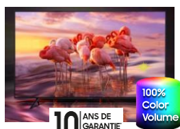
100 % du volume couleur

La technologie Quantum Dots capte la lumière et restitue une palette de couleurs d'un réalisme incomparable qui ne se dégrade pas au fil du temps. Compatible HDR10+, les Q80T atteignent des pics de luminosité jusqu'à 1500 nits.