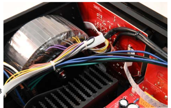
Advance work to stand out focuses on quality essential food linear, starting with the transformer 15 cm toric, tracking filtering by four capacitors 6800 µF / 71 V, then multiple regulations also very well filtered for each circuit from A10.

Modernity is also displayed thanks to a microprocessor which manages all the functions enabled by the central encoder, on which a long or short press allows to access the menus. We can scroll through the inputs: 6 analog on RCA including an MM phono with three capacitance settings (100, 200, 320 pf), a symmetrical line on XLR, 5 digital including 3 optics, one S / PDIF and one USB audio, plus a connector for a bluetooth receiver XFTB01 aptX or XFTB02 aptX HD. An USB-A accepts audio files MP3 from a walkman or a USB key. Originality: two HDMI, including one for a DVD in order to benefit from the quality audio signal from the A10, and a HDMI ARC to connect a screen to CEC protocol, can be activated in the System Setting menu.