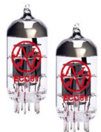
DOUBLE TRIODE TUBES

The A10 wins all the votes, can even show to much more ambitious and expensive than him. A great success in perspective !