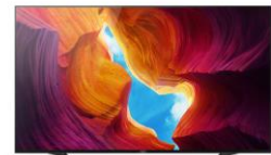
Pieds en position central